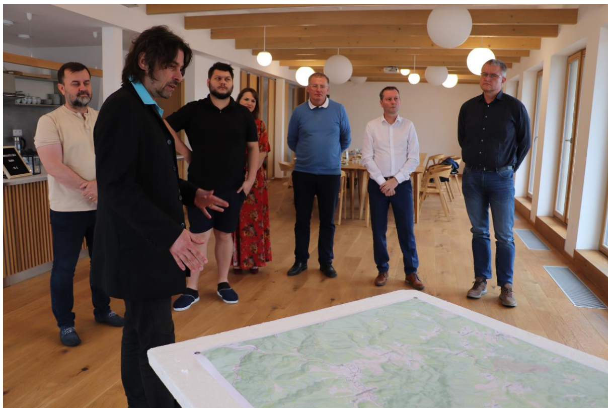
Obr.č.14: Aktivita pocitové mapy pro podnikatele

Projekt pocitové mapy pro podnikatele byl hrazen z prostředků ESF.