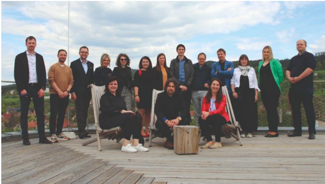
Obr.č. 9: Členové Zlinnovation ve Valašských Kloboukách 11. 5. 2023

V roce 2023 proběhlo historicky první výjezdní zasedání celé platformy na jednání a prezentaci partnera – VPC, do Valašských Klobouk.