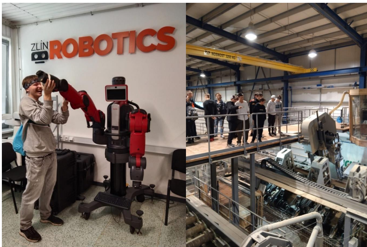
Obr.č.10 a 11: Žáci ZŠ na exkurzích po firmách v rámci Technodays 2023