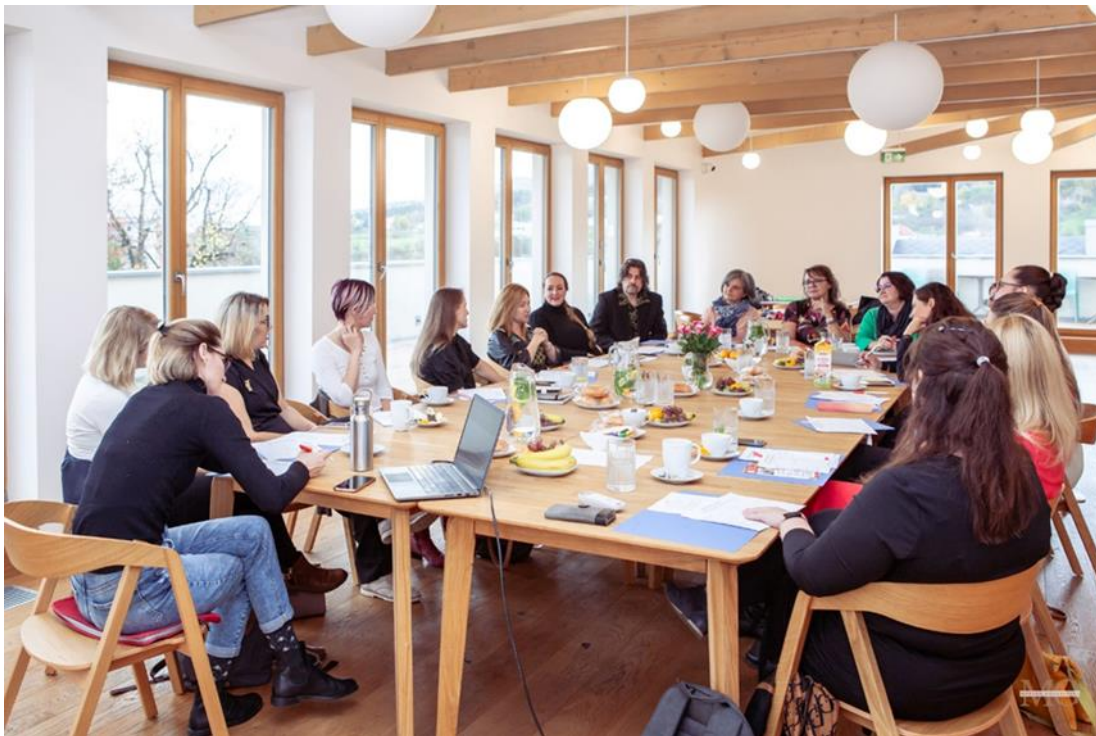
Obr.č.12: Fórum podnikatelek Zlínska a Valašska v Domě na rohu