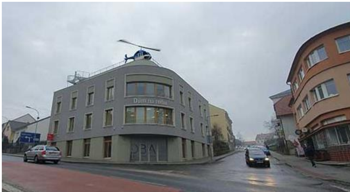
Obr.č.16: Hypotetický heliport na střeše Domu na rohu

... a proběhlo mnoho dalších soukromých, polosoukromých, poloveřejných akcí.