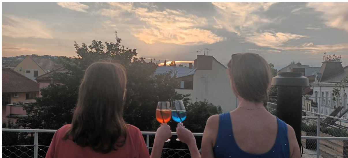
Obr.č.15: Letní pohoda při podnikatelských akcích v Domě na rohu

V roce 2023 proběhly již zaběhnuté akce jako byly Víno a cimbál pod hvězdami a město plné hvězd a dále se rozvinuly akce na podporu podnikavosti při videokavárnách a při hudbách na západ slunce. Vznikly zajímavé akce z oblasti propagace místní gastronomie a řemesel, ve spolupráci se SOU Valašské Klobouky proběhly Zvěřinové a Martinské hody. Všechny tyto akce se těšily velkému zájmu návštěvníků, proto v nich hodláme pokračovat také v roce 2024. Samozřejmě se plánují také akce nové dle zájmu potenciálních spolupracujících subjektů.